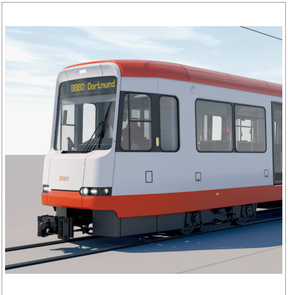
Frontansicht / Front view