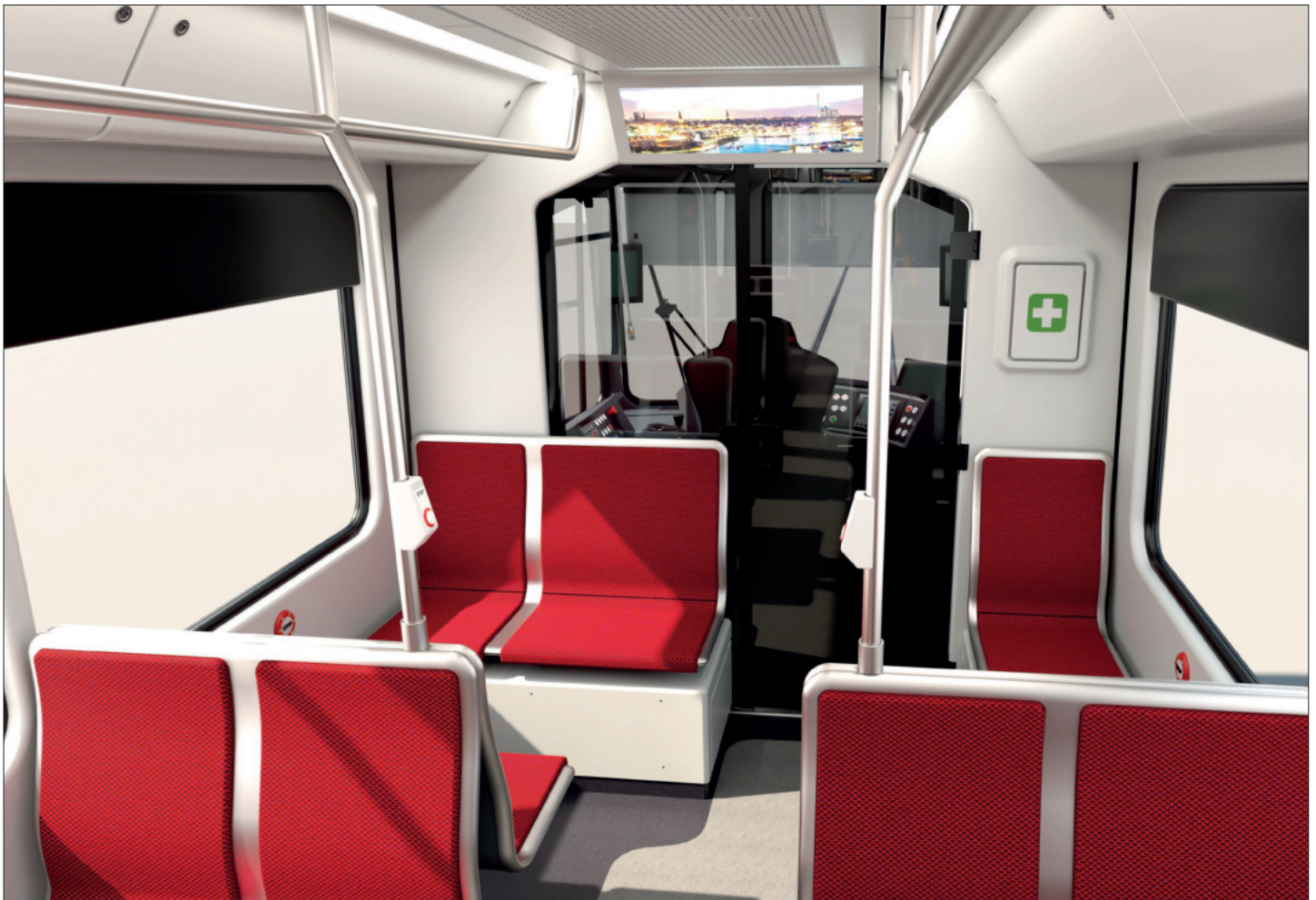
Interieur / Interior DSW21 B-Wagen neu