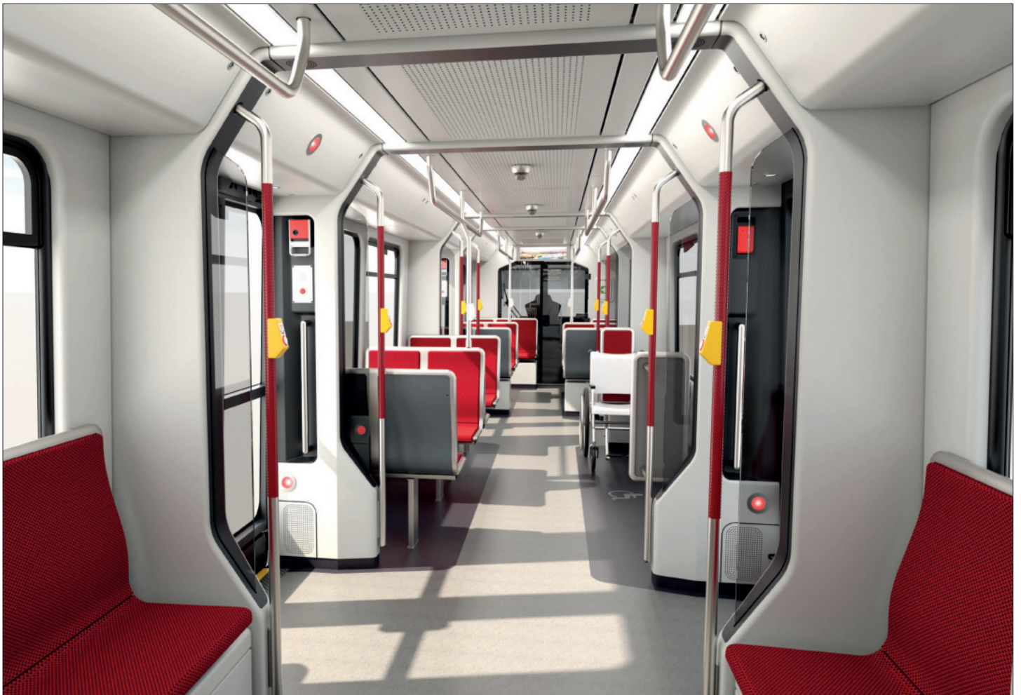
Interieur / Interior DSW21 B-Wagen neu